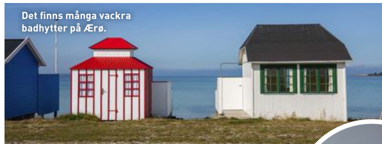
Det finns många vackra badhytter på Ærø.

VÄRLDENS GODASTE ÄPPELKAKA Ekologiskt och hemlagat med fokus på smakrikt som även är en fröjd för ögat. Kanske är det här som man hittar världens godaste äppelkaka – den smakar på något sätt extra mycket av allt. Nej, det är inte en klassisk äppelkaka, utan den är krämig och väl avvägd. Om vädret tillåter är ett tips att sätta sig utomhus på deras mysiga innergård. Här serveras både frukost, brunch, lunch och tapas av olika slag. Ett väldigt trevligt ställe att varva ner på och ta en kopp kaffe. På kaféet finns också en butik där man kan köpa med sig diverse godsaker och presenter. fleuri.dk