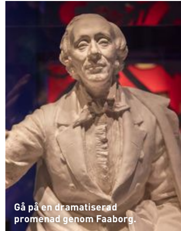
Gå på en dramatiserad promenad genom Faaborg.