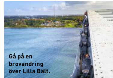
Gå på en brovandring över Lilla Bält.