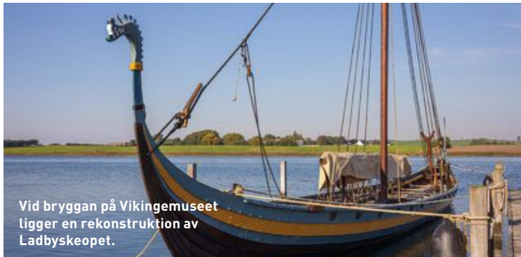
Vid bryggan på Vikingemuseet ligger en rekonstruktion av Ladbyskeppet.