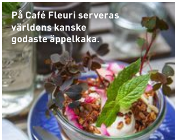
På Café Fleuri serveras världens kanske godaste äppelkaka.