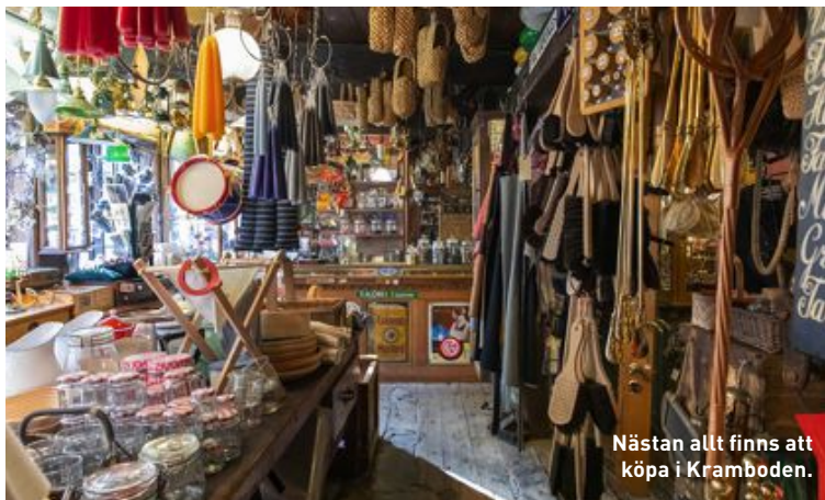
Nästan allt finns att köpa i Kramboden.

staden är Arresten. Här erbjuds besökarna att få känna på hur det var att sitta fängslad, då detta tidigare var ett fängelse. Läs om fångar och hur livet i fängelse kunde te sig. För de yngre besökarna finns olika stationer, varav en är att man får prova att såga sig igenom ett fängelsegaller. En sak är säker – det tar väldigt lång tid. visitfaaborg.com