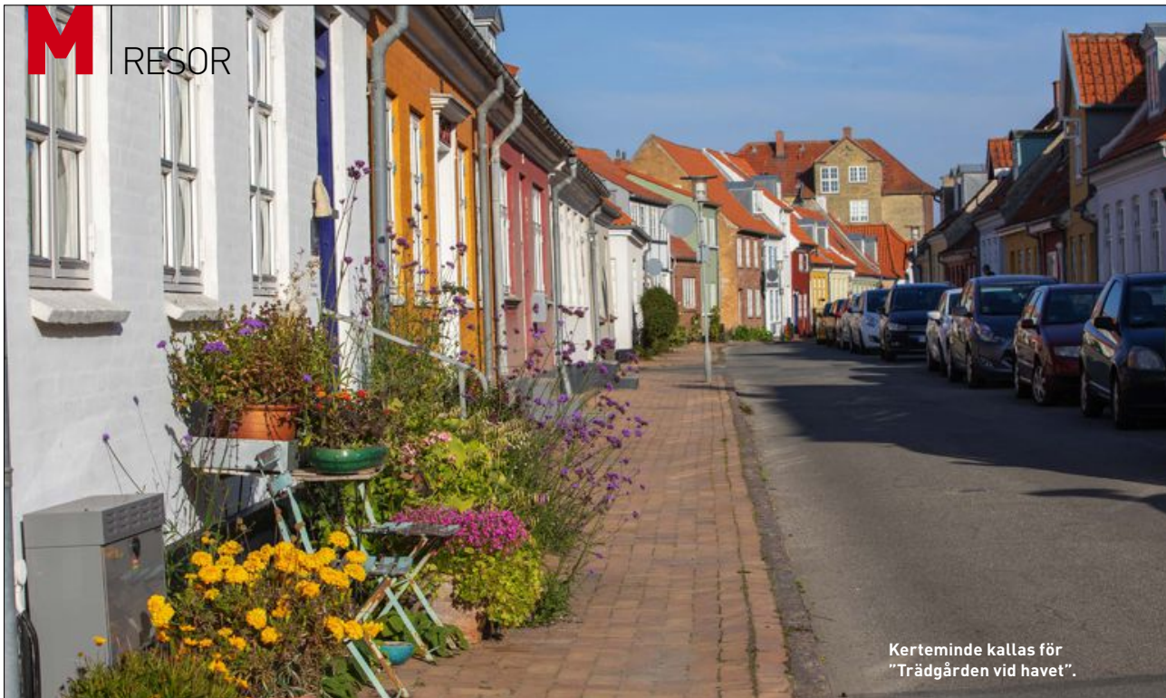
Kerteminde kallas för "Trädgården vid havet".